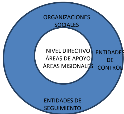
Ilustración 2. Actores internos y externos

De esta forma para los aliados internos se plantean estrategias dirigidas a promover el trabajo en equipo, con comunicación clara, oportuna y eficiente y la generación de herramientas que permitan adelantar procesos de seguimiento físico, financiero, cumplir con la misionalidad de la entidad y la evaluación de las acciones, con el fin de generar información actualizada y adecuada para brindar asesoría pertinente para la toma de decisiones.