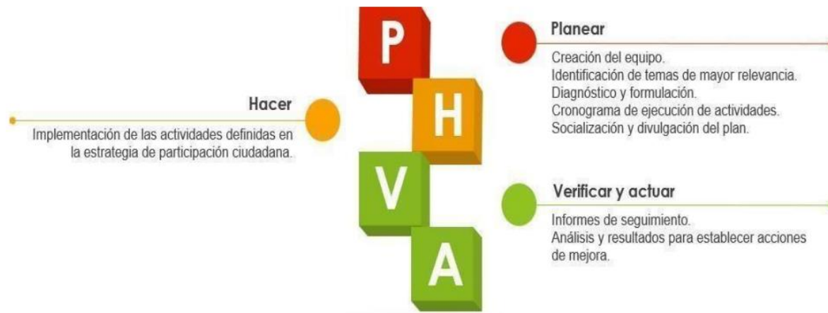
Ilustración 5. Etapas Plan de participación.

La realización de los espacios y actividades definidas en el presente plan, deben seguir la siguiente metodología, de acuerdo con el ciclo PHVA (planear, hacer, verificar y actuar), el cual se encuentra integrado en el MIPG. Este ciclo permite dirigir, planear, ejecutar, hacer seguimiento, evaluar y controlar la gestión institucional, atendiendo las necesidades de los ciudadanos.