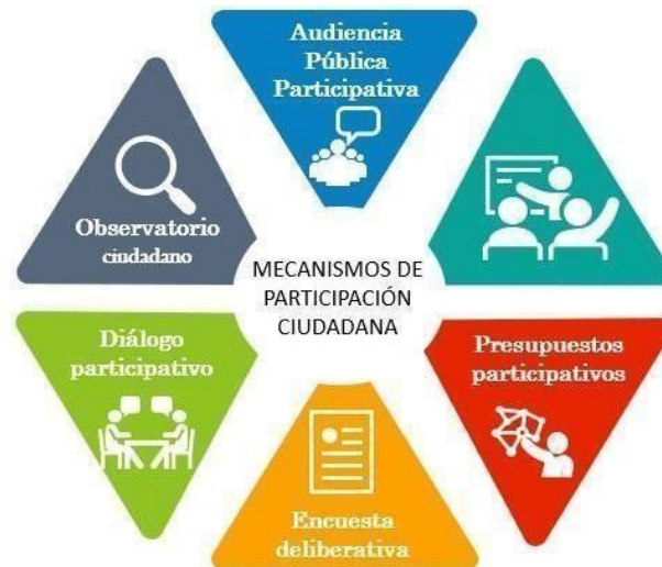
Ilustración 4. Mecanismos de participación

Los mecanismos empleados para promover la participación ciudadana en la entidad son los siguientes: