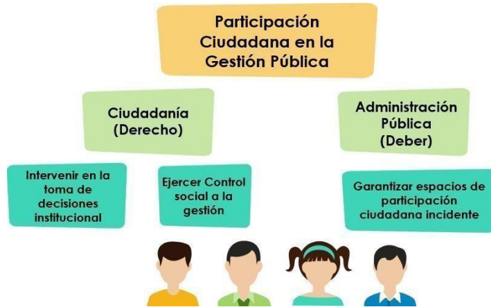
Ilustración 3. Roles en la participación ciudadana.