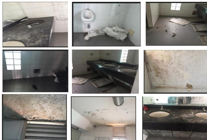
Foto 1 Baños Plaza de eventos No. 2

Al realizar visita ocular a la obra ejecutada dentro del contrato de obra pública No. 398 de 2017, cuyo objeto fue "Realizar la impermeabilización y sellamiento de filtraciones en las placas de las azoteas del recinto ferial plaza de los artesanos, azoteas de los baños ubicados en las plazas de eventos No. 1, 2, 5, 6, 7 y 8, cambio de canaletas de las cubiertas de las oficinas talleres Tukano, Maku, Kankuamo, Ika, Barazana, Cubeo y Embera, y mantenimiento de la cubierta del auditorio de la Plaza de los Artesanos de la Secretaría Distrital de Desarrollo Económico de Bogotá", se evidenció el cumplimiento del objeto y obligaciones contractuales; sin embargo, al verificar el interior de los baños de la plaza de eventos No. 2, se observó el estado de ruina, deterioro y suciedad en que estos se encuentran, como se aprecia en las fotografías: