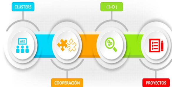
Figura 1. Innovación modelo de clusters