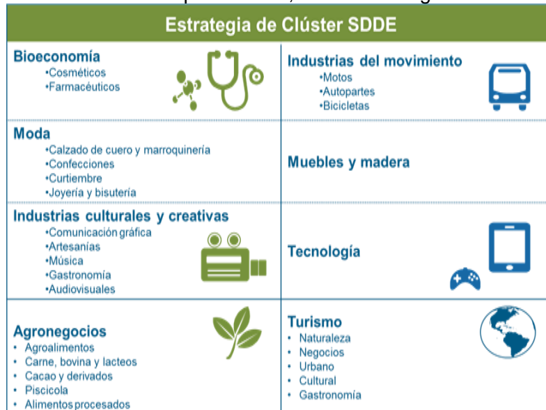
Tabla 5. Sectores productivos, Clústeres o aglomeraciones