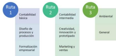
Figura 5. Rutas de fortalecimiento