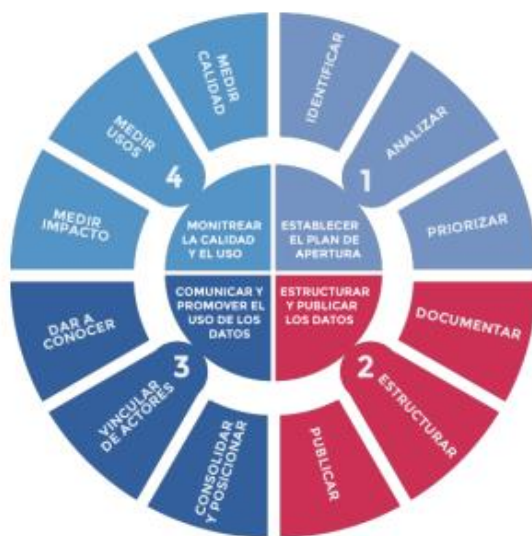
Ciclo de vida de los datos

A continuación, se presenta la metodología que se aplicará para la ejecución del Plan de apertura 2024, a partir del ciclo de vida de los datos, que se ilustra en la siguiente figura: