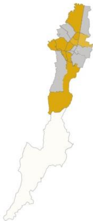
Tabla 1: Territorialización localidades Bogotá Productiva Local