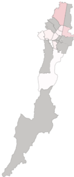
Imagen 2: Territorialización localidades Bogotá productiva Alto Impacto Tabla 2: Territorialización localidades Bogotá productiva Alto Impacto