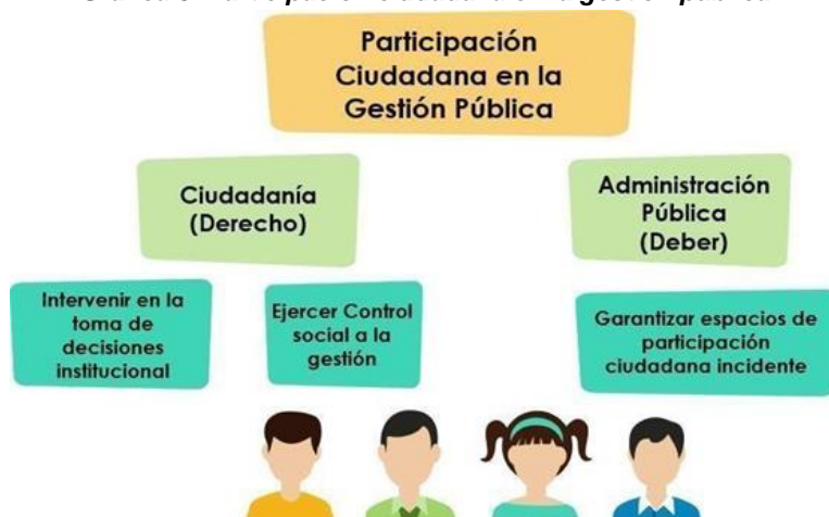
Gráfica 3. Participación ciudadana en la gestión pública

En la siguiente gráfica se define el proceso de participación ciudadana en la gestión pública entendida como un derecho y un deber.